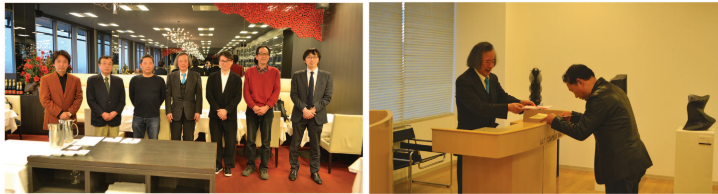
会食後の記念撮影 / 授賞式の様子

今年度の彫刻コンクールは、どの作品もクオリティが高く、製作者の皆様の熱意が伝わってくるものばかりでした。2018年春に神戸ポートアイランドに開館予定の「日本芸術会館」に今回の入選作品が収蔵されます。現代の作家の皆様の作品と熱意を鑑賞できる場となりますので、是非お越し下さい。