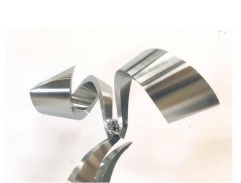
「Natural Posture」 水本 智久