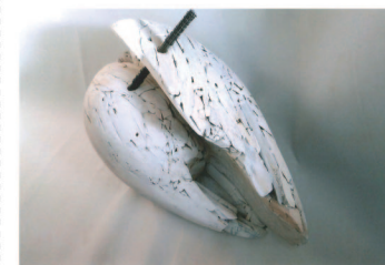
「夏の記憶」 上原 佳代