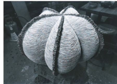
「生きものの領域01」 青木 邦真