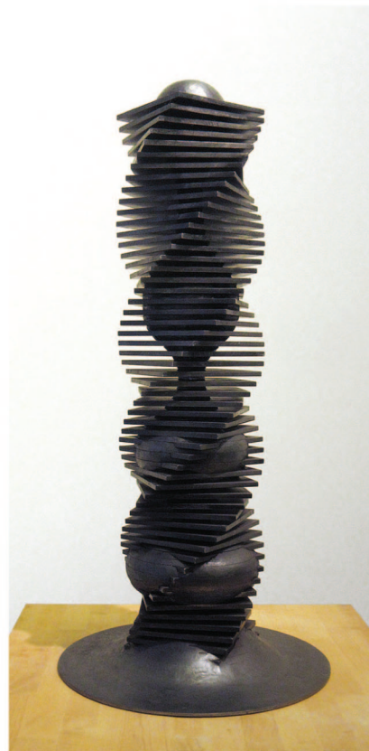
「間 - bubble」