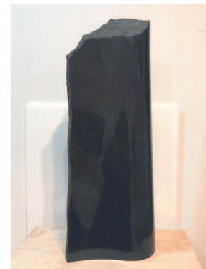
「進化景色(風をうけて)」 土田 義昌