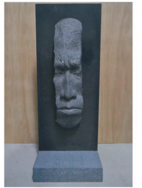
「SADNESS」 玉本 崇晴