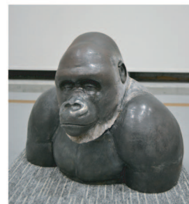
「またこの場所で」 倉富 隆行