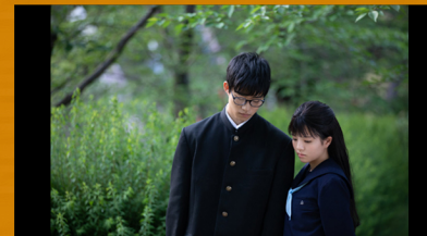
「にしきたショパン」 竹本祥乃監督