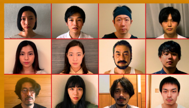
「2020年 東京。12人の役者たち」